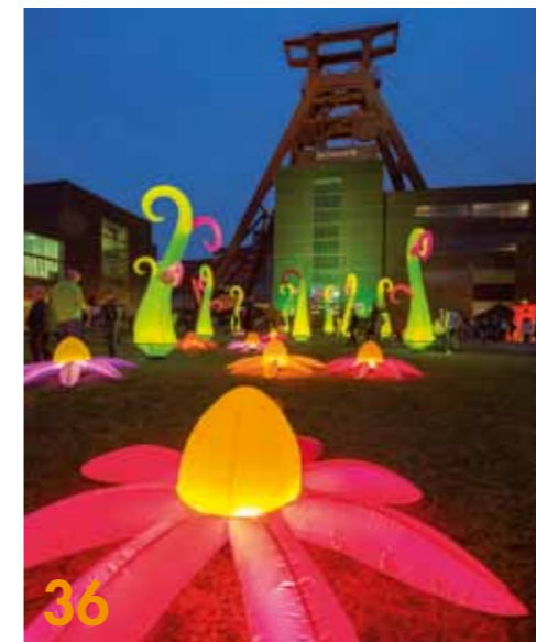
36 Die ExtraSchicht feiert die Identität des Ruhrgebiets