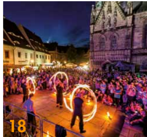
18 Zwickau bietet zahlreiche Events zum Jubiläum