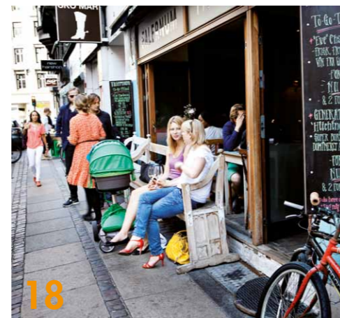
18 Kopenhagen ist ein beliebtes Tourismusziel. Vor allem die Cafés und Märkte ziehen die Gäste an