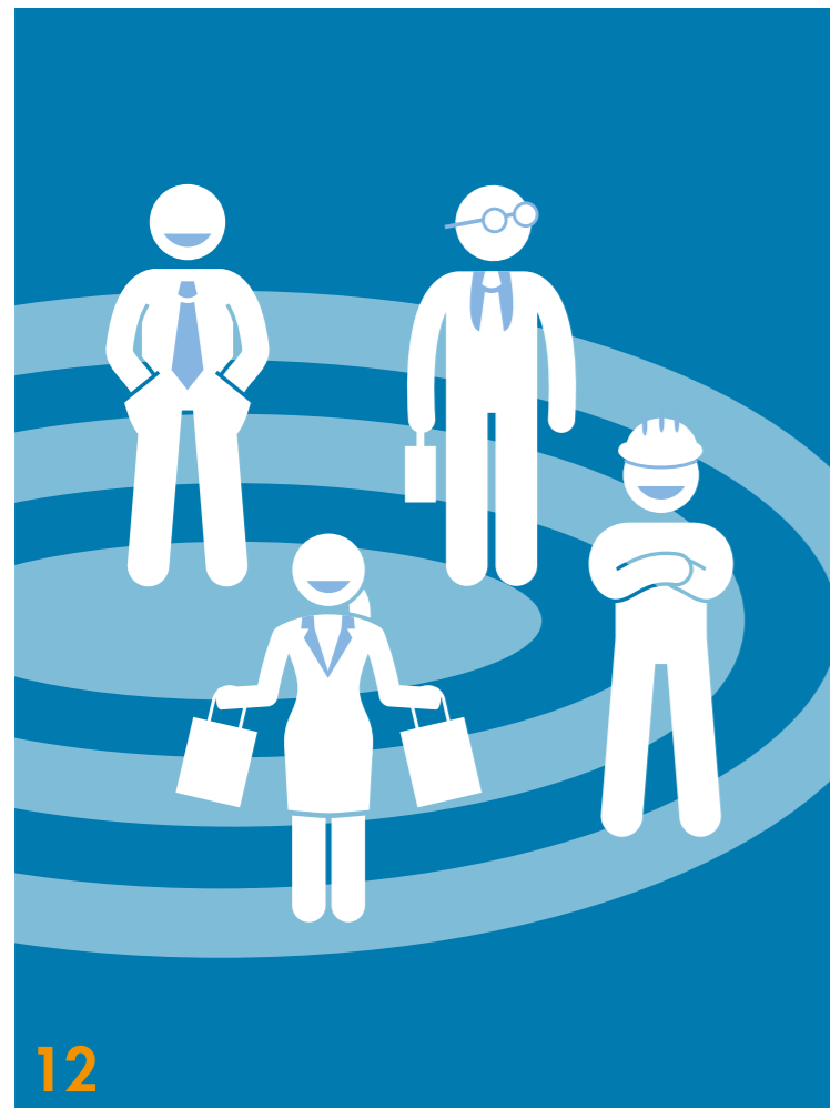
Weiche Standortfaktoren, beispielsweise ein attraktiver Stadtkern mit Einkaufs- und Freizeitangeboten, beeinflussen zunehmend die Entscheidung von Arbeitnehmern für oder gegen einen Lebensort

12 VIELFALT ZAHLT SICH AUS: Die Studie „Vitale Innenstädte“ zeigt auf, welche Städte mit einer attraktiven City punkten – und damit Besucher wie auch Fachkräfte anlocken können