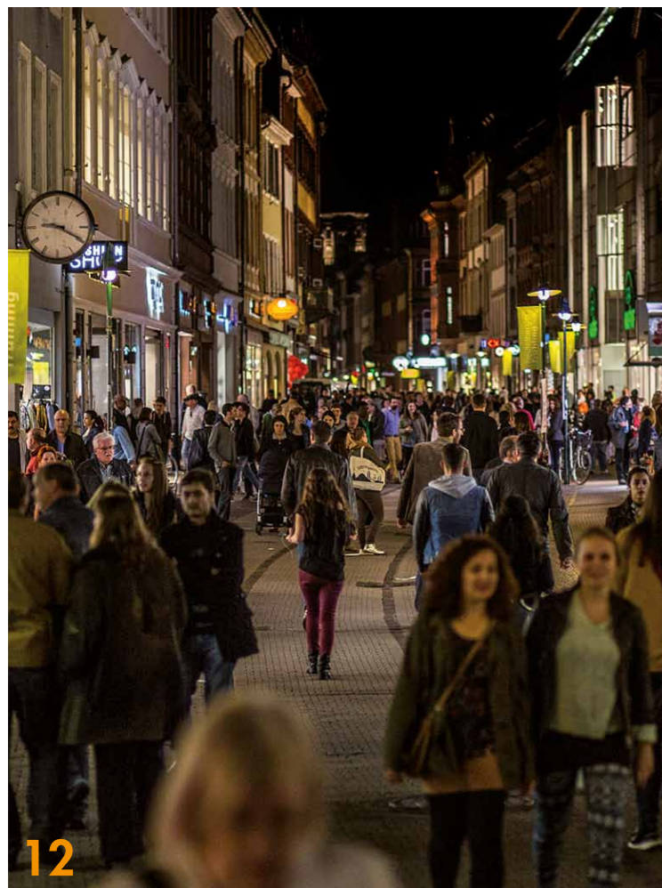
Die Heidelberger Innenstadt war vor der Corona-Krise ein Besuchermagnet. Das soll auch durch die erneute Öffnung der Geschäfte und kulturellen Institutionen wieder so werden