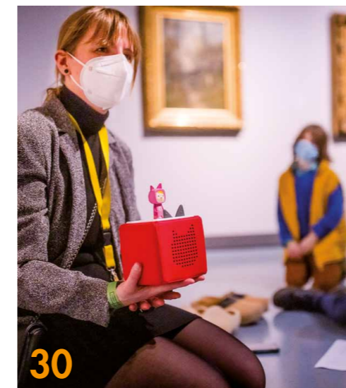
Der Kunstpalast Düsseldorf bietet für die Schau „Ich, Max Liebermann“ Tonie-Figuren für Kinder an