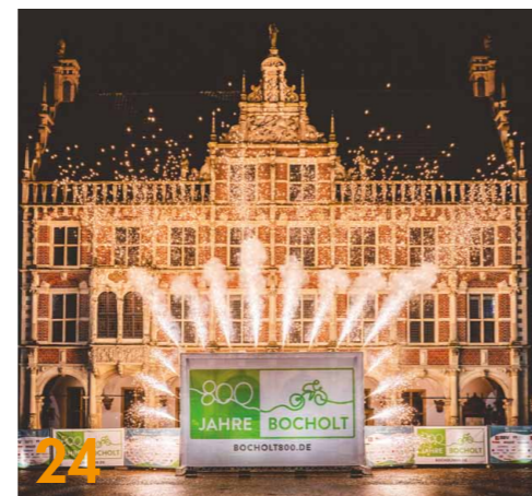
Am 17. Januar 2022 fiel um Mitternacht der Startschuss für das Jubiläum „800 Jahre Bocholt“