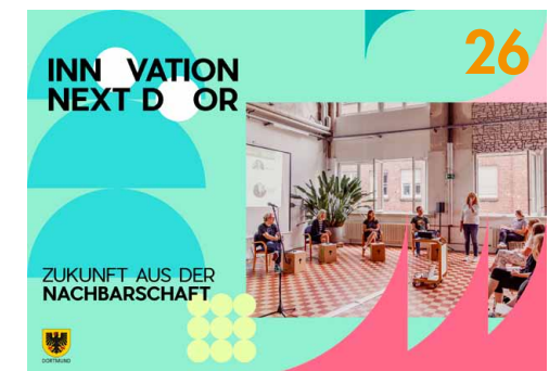
Das Greenhouse.Ruhr gehört zur Initiative „Innovation next door“. Gründer*innen werden unterstützt, ökologische Ideen weiterzuentwickeln