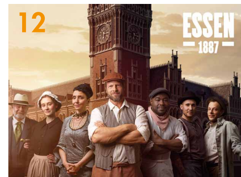
Die Hauptfiguren der Mixed-Reality-Stadtführung in Essen werden von lokalen Berühmtheiten verkörpert