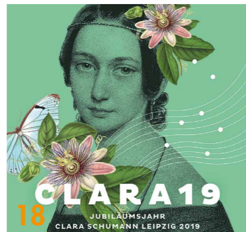
Die Flyer und Plakate zum Schumann-Jubiläum zeigen die eigens kreierte Wort-Bild-Marke