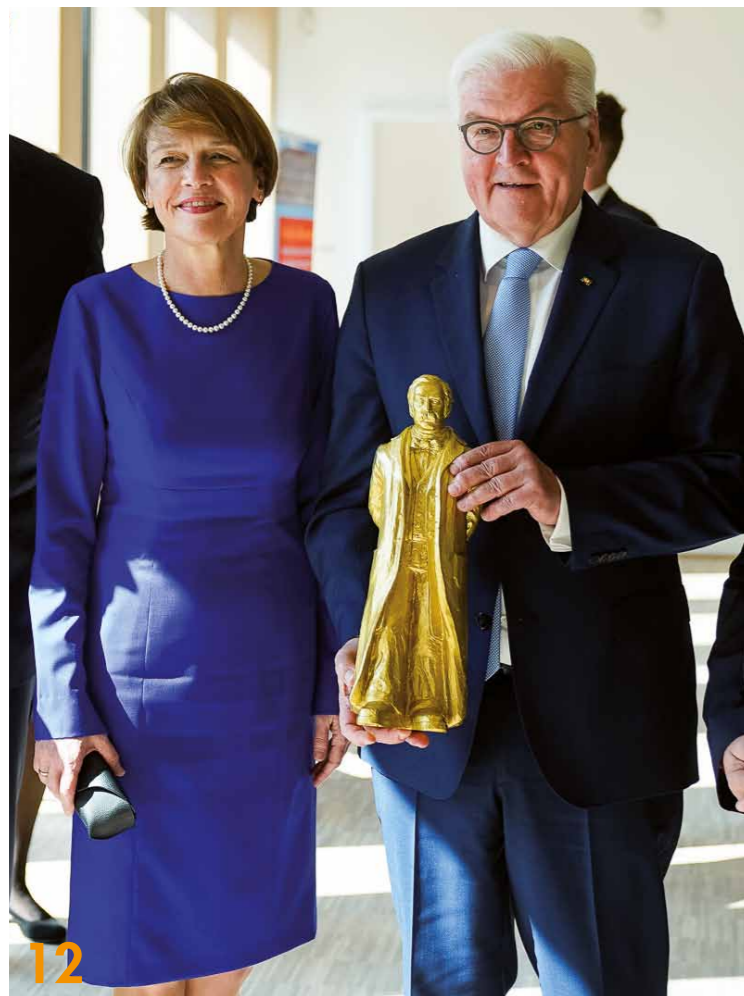
Neuruppin steht im Zentrum des Fontane-Jubiläums 2019. Zur Eröffnung kam Bundespräsident Frank-Walter Steinmeier (r.) in Begleitung seiner Frau Elke Būdenbender in die brandenburgische Stadt