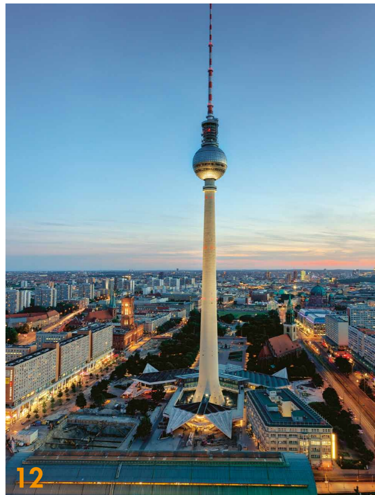
Berlin besitzt große Strahlkraft und ein hohes Ansehen, aber hinter der Marke Berlin steckt noch so viel mehr. Die wichtigsten Aspekte sollen in das künftige Hauptstadtmarketing fließen

12 AUF DER SUCHE NACH DER DNA BERLINS: Berliner Senatskanzlei und Agentur ressourcenmangel geben Einblick in den Stadtmarken-Entwicklungsprozess und das daraus entstandene Leitbild der Hauptstadt