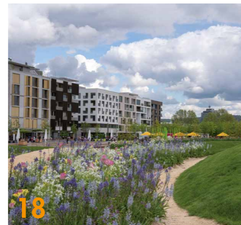
18 Bundesgartenschau Heilbronn verknüpft erstmalig Garten- und Stadtausstellung