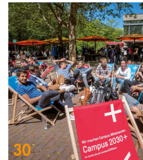
Die ersten Ergebnisse des neuen Corporate Designs der Hochschule Karlsruhe wurden im Sommer 2019 bei einem Campus-Fest diskutiert