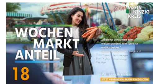
Im Zentrum der Kampagne stehen Menschen, die im Main-Kinzig-Kreis leben und arbeiten