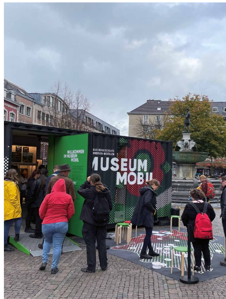
Das MuseumMobil des Hauses der Geschichte NRW ist in ganz Nordrhein-Westfalen unterwegs

18 MOBILE MUSEEN ALS TÜRÖFFNER: Immer mehr Museen begeben sich auf eine Reise durch die Bundesrepublik, um näher bei den Menschen zu sein. Drei Kulturinstitutionen berichten