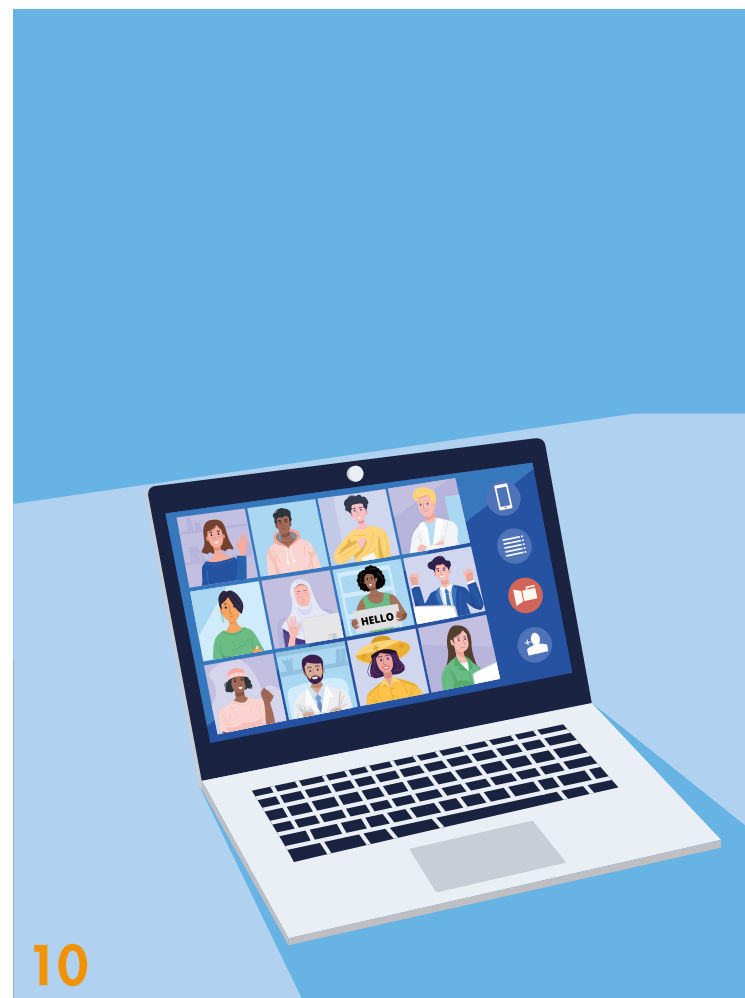
Die Kommunikation hat sich zunehmend ins Digitale verlagert. Entscheider*innen der Kulturbranche greifen aktuell auf Dienste wie Zoom und Trello zurück, um weiterhin agil zu bleiben

10 KOMMUNIKATION IM WANDEL: Der öffentliche Sektor geht in der Kommunikation neue Wege. Entscheider*innen der Kulturbranche berichten, wie sich die interne Kommunikation verändert hat